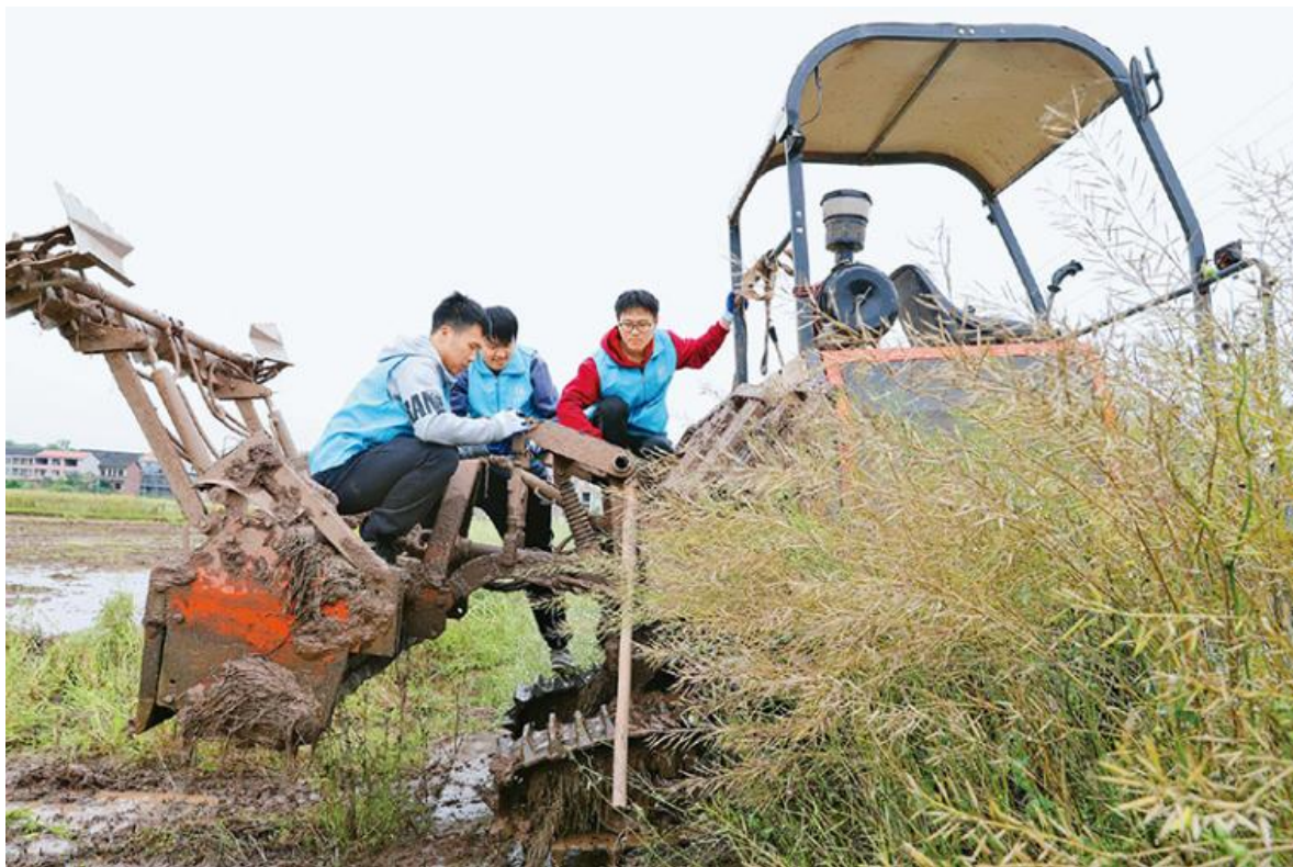
图为2023年4月29日，南华大学的大学生志愿者利用五一假期到湖南省衡阳市衡阳县西渡镇新桥村开展劳动助农行动，帮助农民检修、保养农机，用劳动实践助力乡村振兴。

强化为党育人、为国育才初心使命。全面系统整体落实党对教育工作的全面领导，坚持把党的政治建设摆在首位，深化“讲政治、守纪律、负责任、有效率”模范机关创建，引导干部始终忠诚核心、拥戴核心、维护核心、捍卫核心，走好践行“两个维护”的第一方阵。把贯彻落实习近平总书记关于教育的重要论述和重要指示批示作为第一优先级事项，健全从交办、反馈、督办到办结销号全链式督查流程，始终做党中央战略意图的忠诚实践者，围绕党中央、国务院重大决策部署形成重点工作分工实施方案，确保落地生根、见到实效。