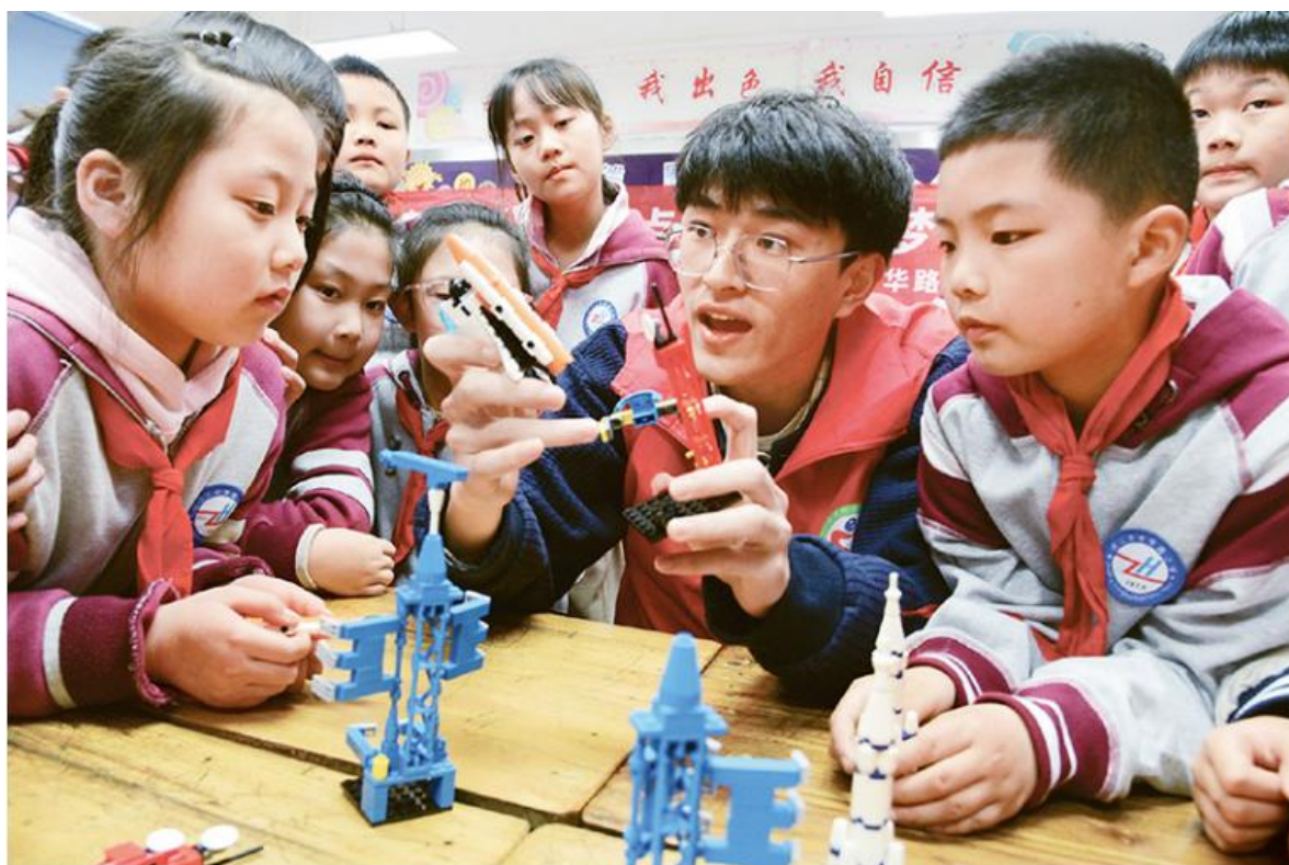
图为2023年4月23日,在江苏省镇江市中华路小学开展的“乐学航天科普 点亮星空梦想”活动中,江苏科技大学志愿者通过航天发射器模型为小学生讲解航天科普知识。

坚持开门办教育,在大兴调查研究中问计于民、问需于民,找准新时代新征程人民群众对教育的新关切新期盼。面向社会主义现代化国家的新方位新愿景,人民群众的教育需求呈现出一些新特征。比如,老百姓以前最关心的“有园上”、“有学上”问题基本解决,但“入好园”、“上好学”、“就好业”的愿望更强烈了;“双减”之后,家长对发展素质教育、学校课后服务供给质量、满足学生个性化发展需求的意愿更强烈了;随着城镇化发展、人口和社会结构变化,群众对城乡教育布局结构和资源配置,对职业教育、继续教育、老年教育等贯穿人的全生命周期的教育服务的期盼更强烈了,等等。针对这些